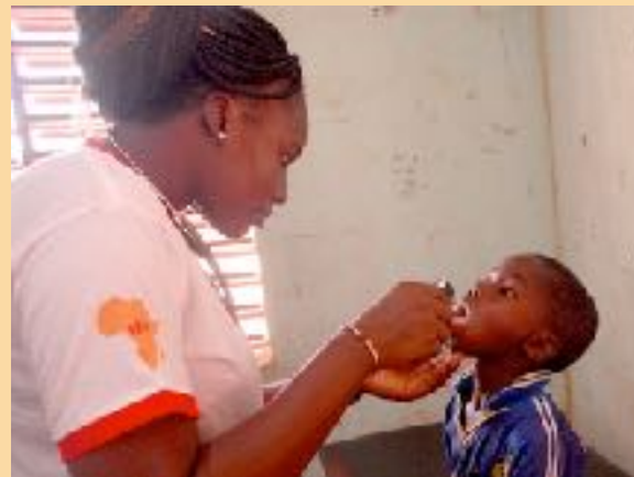
Examen de la gorge et de la bouche